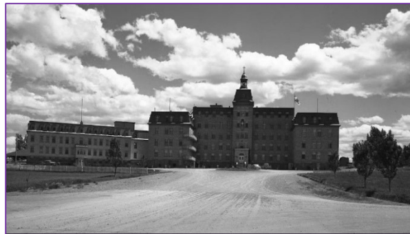
Légende de la photo : Le monastère des ursulines, photographié ici le 24 juin 1956, a été cédé en 1969 à l'établissement qui allait devenir l'Université du Québec à Rimouski.

Une exposition sur le passage indélébile des ursulines à Rimouski est présentée jusqu'au 31 janvier à la Galerie d'art Mouvement Desjardins de l'UQAR. Celle-ci a été réalisée dans le cadre du cours d'histoire appliquée et de muséologie.