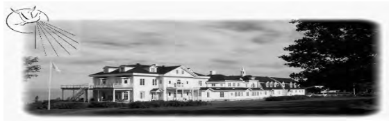
Le Cénacle 383, rue du Patrimoine (132) Cacouna, G0L 1G0