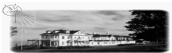
Le Cénacle 383, rue du Patrimoine (132) Cacouna, G0L 1G0