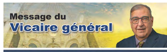
+Denis Grondin Archevêque de Rimouski