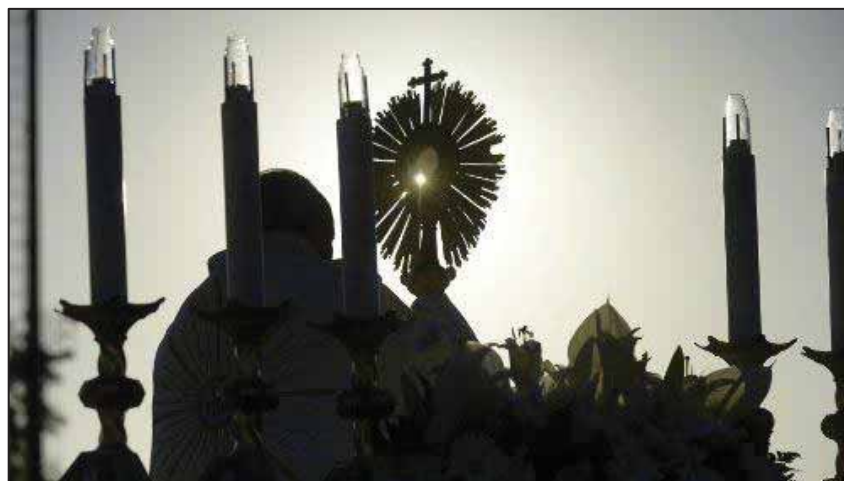
Le Pape François et l'ostensorio du Saint-Sacrement