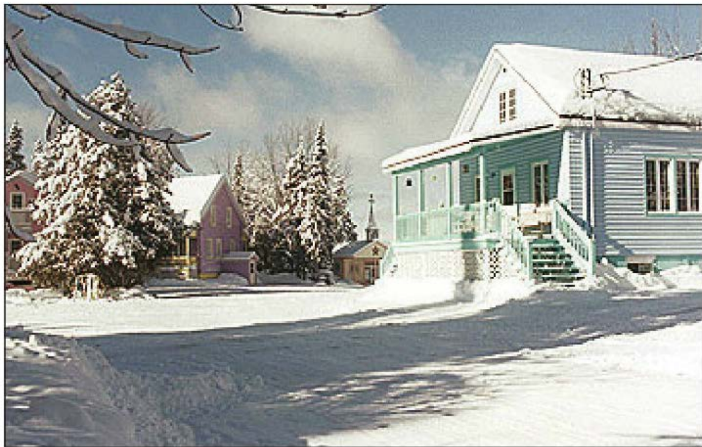
Le Village des Sources a accueilli 50 000 jeunes depuis son ouverture.

Blandine) Pour s'y rendre, emprunter la route 232... (suivre les indications...) près du garage Esso», mentionnent les responsables. À compter de 15 h, il sera possible de déguster de la tire sur la neige. Aussi au programme : écouter le chant des oiseaux, reluquer les chevreuils, visiter les nouveaux sentiers, visionner les faits saillants du Village des Sources.