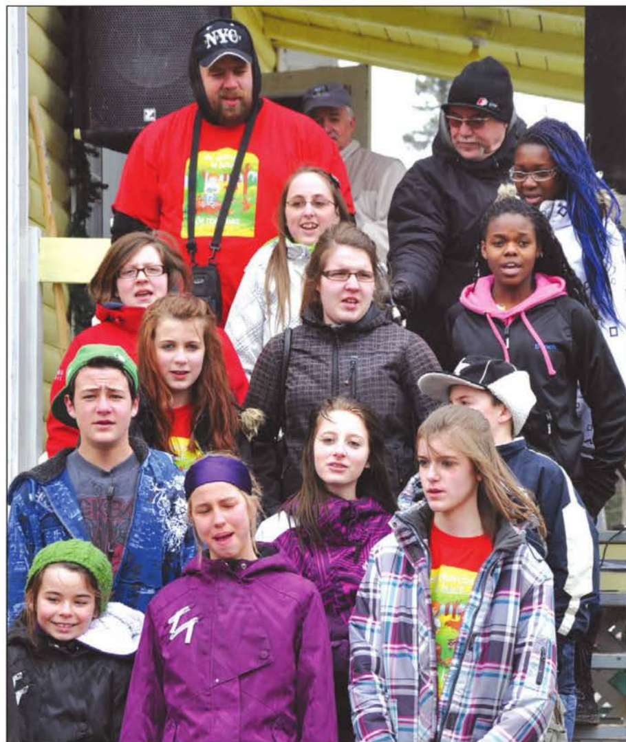
Un groupe de Biencourt chante la chanson thème de Chanter la Vie.

Prince-Édouard et aux Îles-de-la-Madeleine, là où vont ouvrir les 4 e et 5 e Village des Sources. Un méga spectacle avec une cinquantaine de musiciens de l'Ensemble Antoine-Perreault aura lieu à la fin août à la Salle DESJARDINS-TELUS.