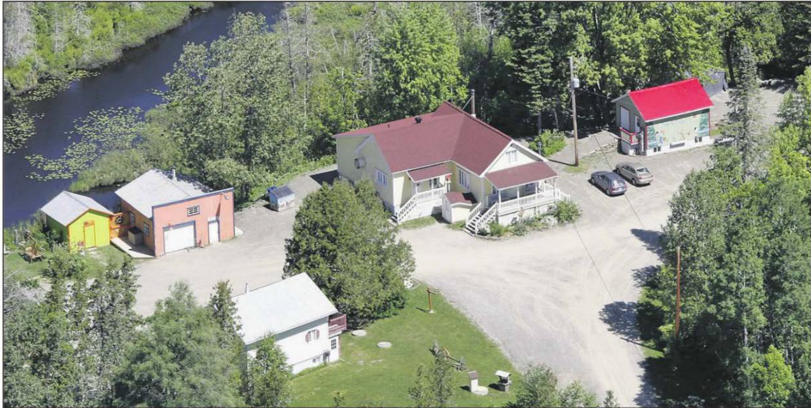
Le Village des sources s'est développé dans un environnement naturel.