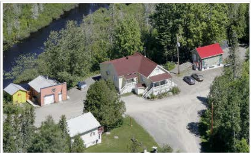
Le Village des Sources s'est développé dans un environnement naturel.

sérieusement la possibilité de devenir propriétaire, afin d'assurer l'avenir de cette infrastructure. Sept personnes y travaillent à plein temps, en plus d'une secrétaire, d'une équipe de cuisiniers et de parents accompagnateurs. La majorité des jeunes qui vivent un séjour au Village des sources sont âgés de 10 à 18 ans.